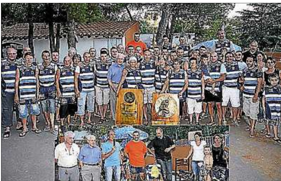
► Dirigeants et sponsors parés pour la nouvelle saison.