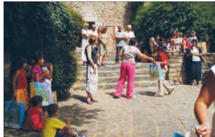
Les jeunes philatélistes ont découvert le monde du timbre poste.