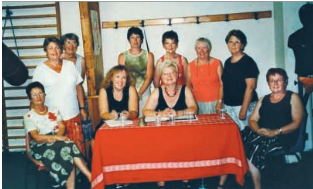
Les membres de la gym volontaire lors de leur dernière assemblée générale.

Après une saison très active, la gymnastique volontaire de Céret s'est réunie dernièrement en assemblée générale.