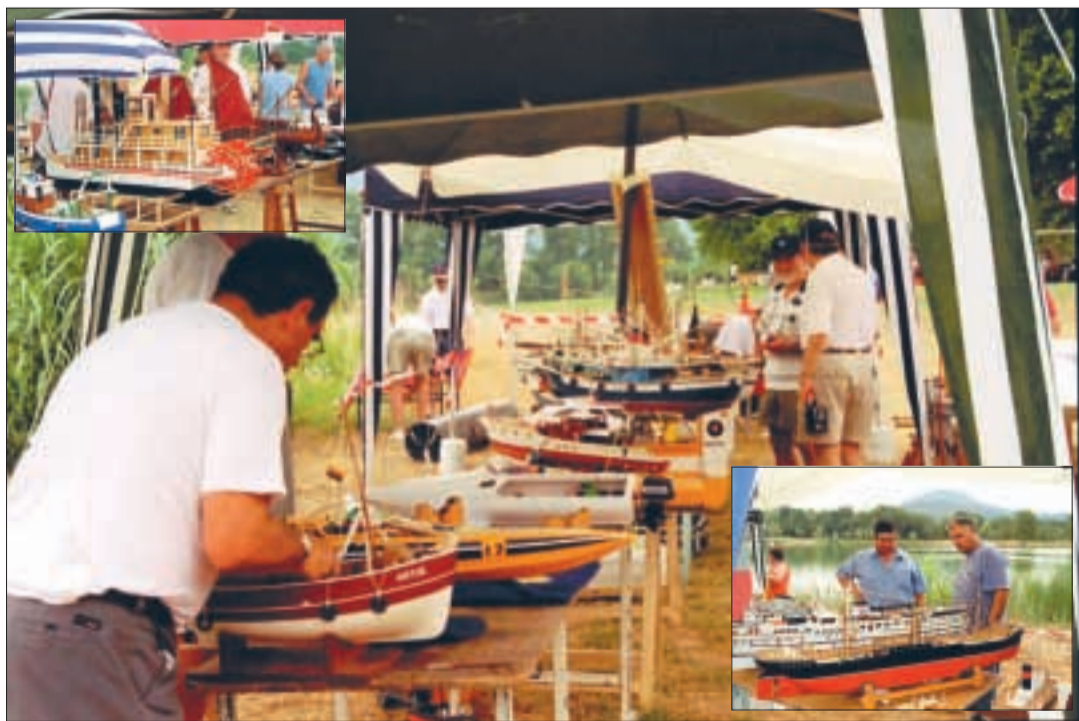
Des maquettes de tous styles et tirants d'eau, des grands navires de croisière aux voiles latines en passant par les drakkars, les remorqueurs ou les offshore.

C'est dans le cadre superbe et ombragé des plans d'eau du village que la 3 e rencontre internationale a attiré un grand nombre de visiteurs.